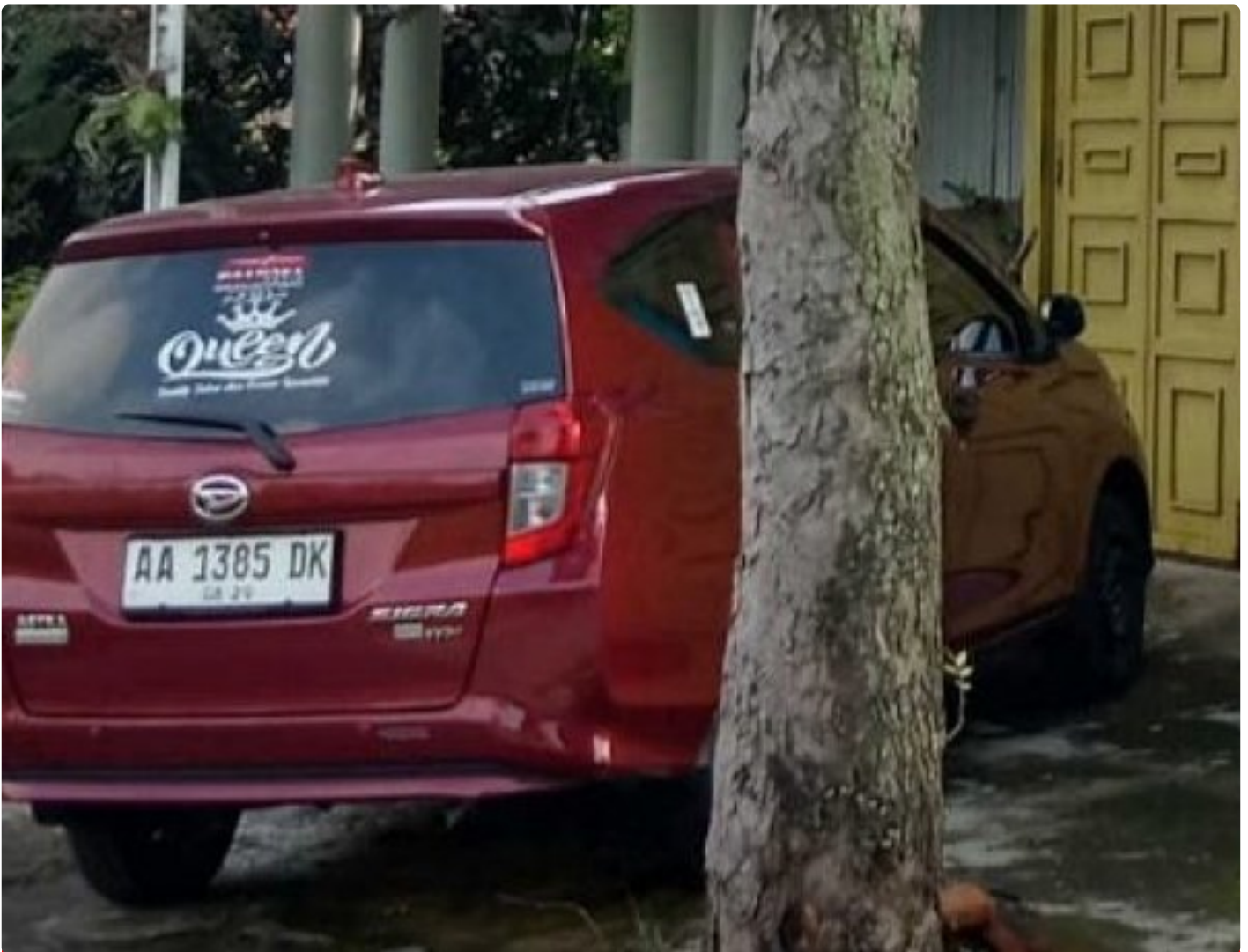
Foto: Mobil yang digelapkan

BOYOLALI - Sebuah laporan penggelapan mobil merek Daihatsu Sigra dengan nomor polisi AA 1385 DK mencuat di wilayah Boyolali, setelah korban melaporkan kejadian tersebut kepada pihak kepolisian. Kasus yang terjadi pada Kamis (2/1/2025) sekitar pukul 13.00 WIB di Dukuh Tegalsari RT 02/RW 02, Tambak, Mojosongo, Boyolali , ini melibatkan kerugian hingga Rp160 juta.